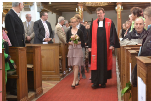
Einzug der Konfirmanden